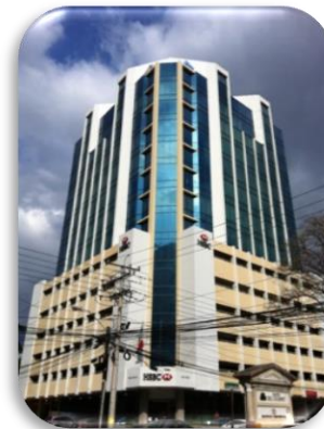
Embajada de México en Panamá

Teléfono de emergencia: (507) 6704-6215.