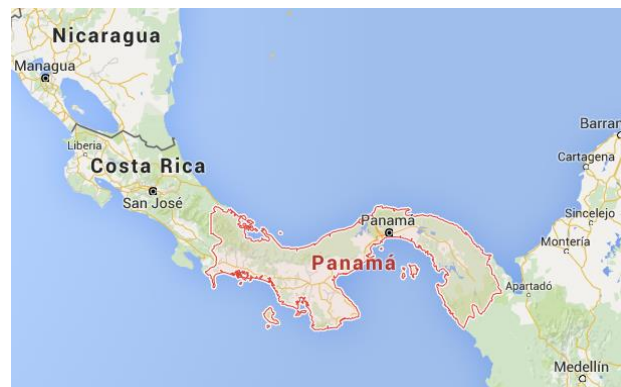
Ubicación de Panamá