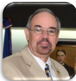
DOCTOR SANTIAGO RIVAS SECRETARIO EJECUTIVO DEL FOPREL