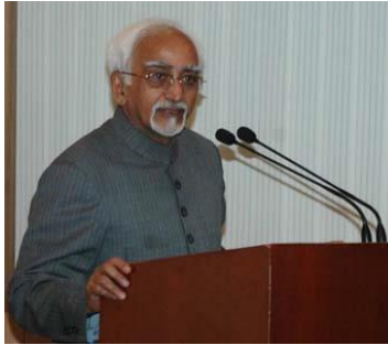
Hon. Sr. Mohammad Hamid Ansari, Vicepresidente de la India Presidente de la Rajya Sabha 4

Nació en abril de 1937, en Calcuta, India. Es politólogo por la Universidad Musulmana Aligarh. Posee una Maestría en Ciencia Política por la misma institución. En 1961, ingresó al Servicio Exterior de la India, donde desempeñó diferentes funciones durante casi cuatro décadas.