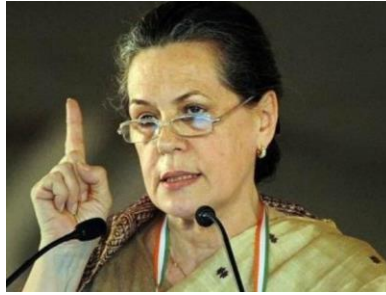
Hon. Sra. Sonia Gandhi, Presidenta del Congreso Nacional Indio 7

Nació en diciembre de 1946, en Italia. Realizó estudios de inglés en Bell Educational Trust, en Cambridge. En 1997, empezó a involucrarse en el sistema político indio, a través de su participación en el Congreso dentro de la Sesión Plenaria de Calcuta como miembro del partido político Congreso Nacional Indio (Indian National Congress). Desde 1998, ha sido Presidenta de dicho partido.