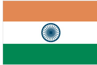
Bandera de India*