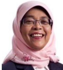
M. HON. SRA. HALIMAH YACOB PRESIDENTA DEL PARLAMENTO DE SINGAPUR (Partido Acción Popular)