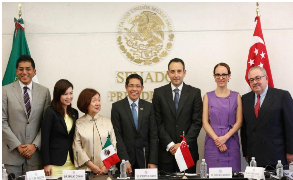
Foto de la Visita.