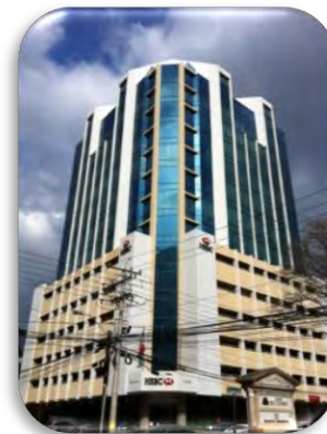
Embajada de México en Panamá

Teléfono de emergencia: (507) 6704-6215.