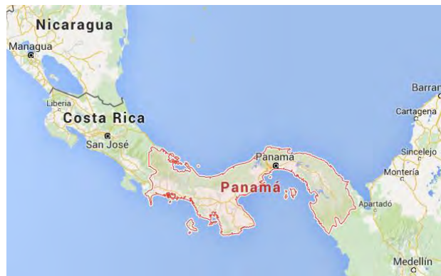
Ubicación geográfica de Panamá