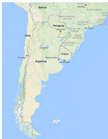
Ubicación Geográfica de Argentina