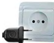
Tipo C: Válido para clavijas E y F