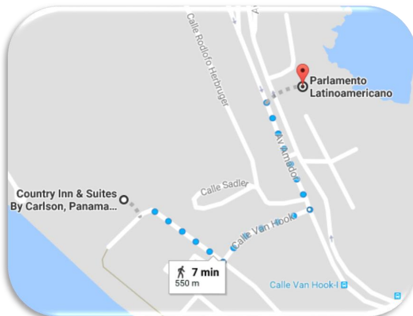
Mapa de ubicación del hotel sede respecto al edificio del Parlamento Latinoamericano y Caribeño