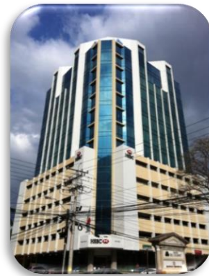
Embajada de México en Panamá

Teléfono de emergencia: (507) 6704-6215.