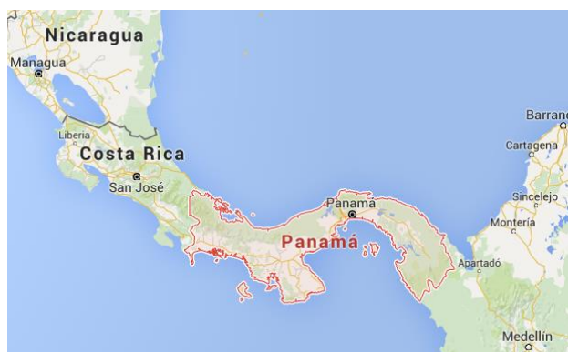
Ubicación geográfica de Panamá