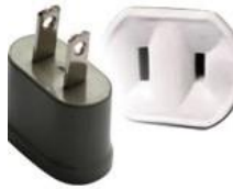
Tipo A: “Clavijas japonesas A”

Las clavijas a utilizar en Panamá son del tipo A / B: