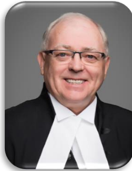
Senador George J. Furey Presidente del Senado de Canadá