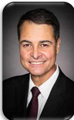
Honorable Anthony Rota Presidente de la Cámara de los Comunes

Nació el 15 de mayo de 1961 en North Bay, Canadá.