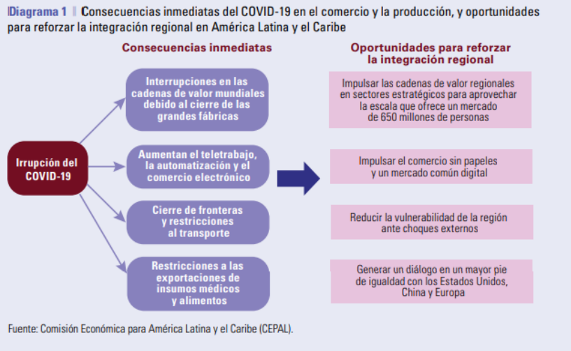
Imagen tomada de la CEPAL. Los efectos del COVID-19 en el comercio internacional y la logística . Consultado el 18 de octubre de 2020 en: https://bit.ly/31jyWCd