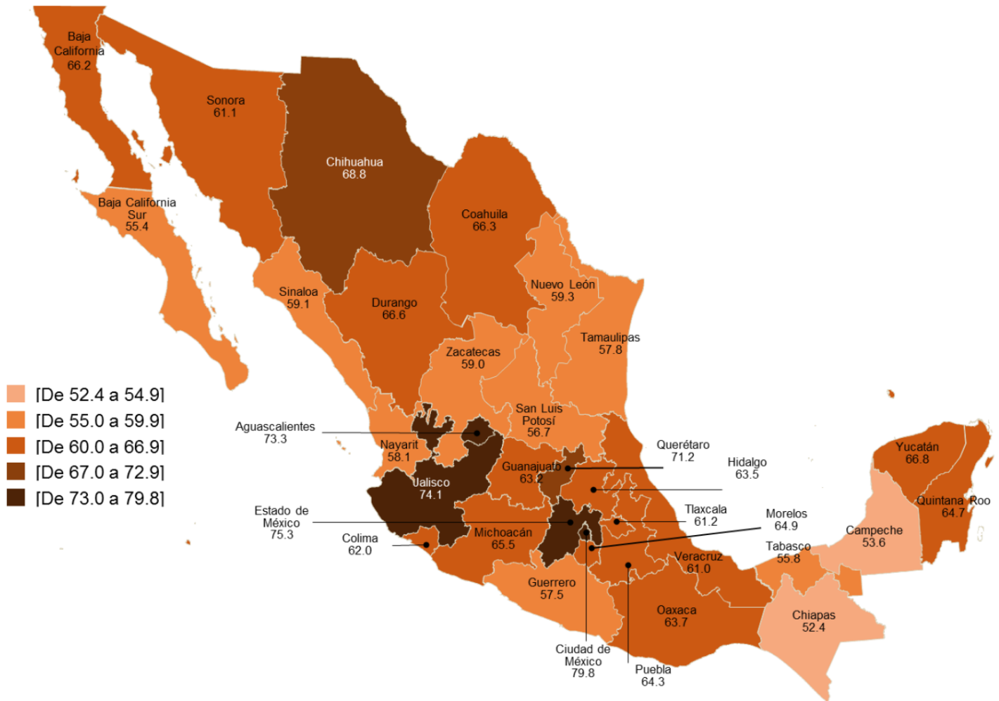
Cuadro. Porcentaje de mujeres que han sufrido cualquier tipo de violencia por entidad federativa

Fuente: INEGI, consultado en la URL: https://www.inegi.org.mx/contenidos/saladeprensa/aproposito/2019/Violencia2019_Nal.pdf