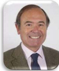
Sr. Pio Garcia-Escudero Márquez Presidente del Senado de España