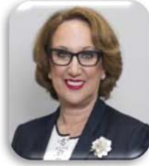
Sra. Rebeca Grynspan Secretaria General Iberoamericana