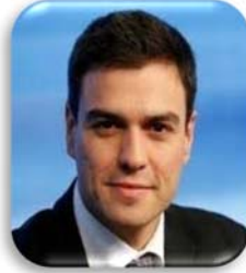
Sr. Pedro Sánchez Pérez-Castejón Presidente del Gobierno de España