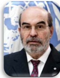
Sr. José Graziano da Silva Director General de la FAO