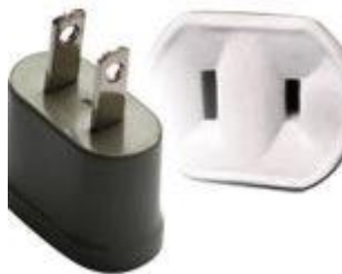
Tipo A: Clavijas japonesas A