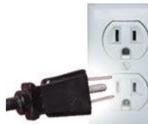
Tipo B: A veces válido para clavijas A

Ambas clavijas son las de uso común en México.