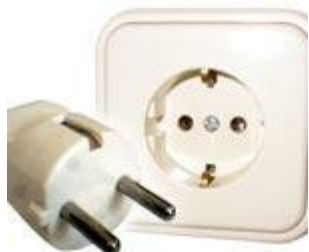
Tipo F: Válido para clavijas C