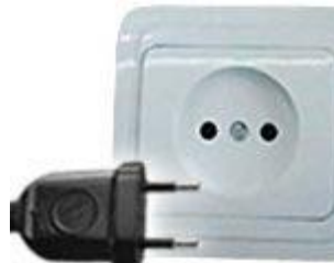
Tipo C: Válido para clavijas E y F