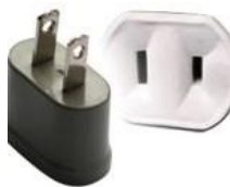
Tipo A: “Clavijas japonesas A”

Las clavijas a utilizar en Panamá son del tipo A / B: