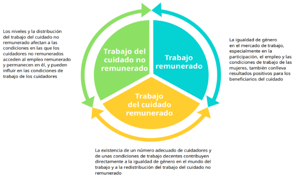
► Gráfico 2. Círculo del trabajo del cuidado no remunerado-trabajo del cuidadoremunerado-trabajo remunerado (diferente del cuidado)

Nota: El trabajo del cuidado remunerado es un subconjunto del trabajo remunerado y todos los segmentos del diagrama influyen en los demás.