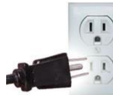
Tipo B: A veces válido para “Clavijas A”

Ambas clavijas son las de uso común en México.