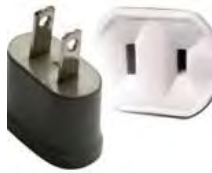
Tipo A: “Clavijas japonesas A”

Las clavijas a utilizar en Panamá son del tipo A / B: