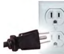
Tipo B: A veces válido para “Clavijas A”

Ambas clavijas son las de uso común en México.