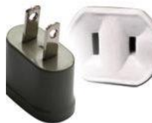
Tipo A: Clavijas japonesas A