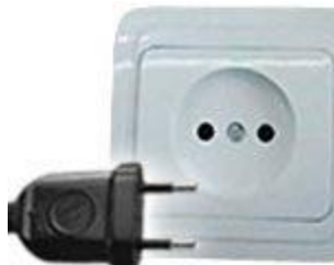
Tipo C: Válido para clavijas E y F