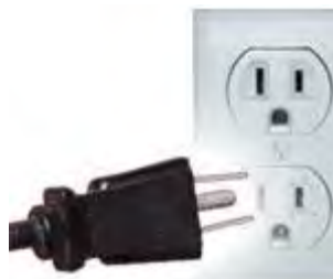
Tipo B: A veces válido para clavijas A