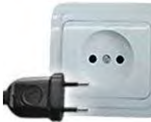
Tipo C: Válido para clavijas E y F