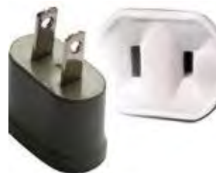
Tipo A: Clavijas japonesas A