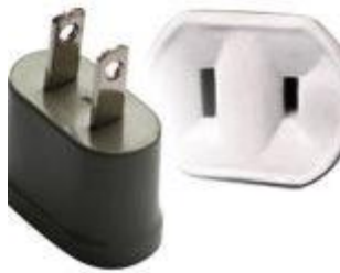
Tipo A: Clavijas japoneses A