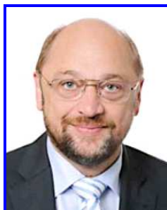
Sr. Martin Schulz Presidente del Parlamento Europeo