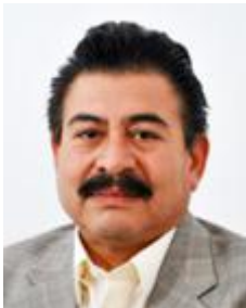
Sen. Isidro Pedraza Chávez. (PRD)