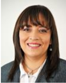
Sen. Lisbeth Hernández Lecona. (PRI)